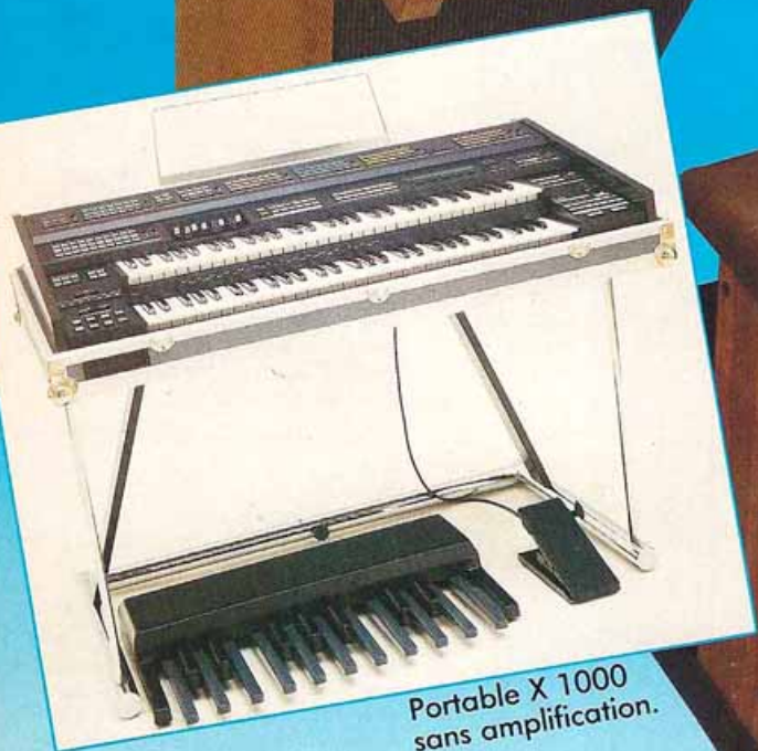
Portable X 1000 sans amplification.

Principales caractéristiques : double clavier, 61 notes (do à do), dynamique avec after touch, pédalier dynamique (18 pédales C 1000, C 2000 25 pédales), registration : orchestra 1 (3 x 19 sonorités), orchestra 2 (3 x 18 sonorités), orchestra 3 (3 x 19 sonorités), orchestra 4 (64 voix + 35 programmables), 3 x 18 sonorités solo, tone wheel, orchestrator, effets digitaux Alesis intégrés, section rythmique PCM (20 rythmes, 4 variations pour chaque).