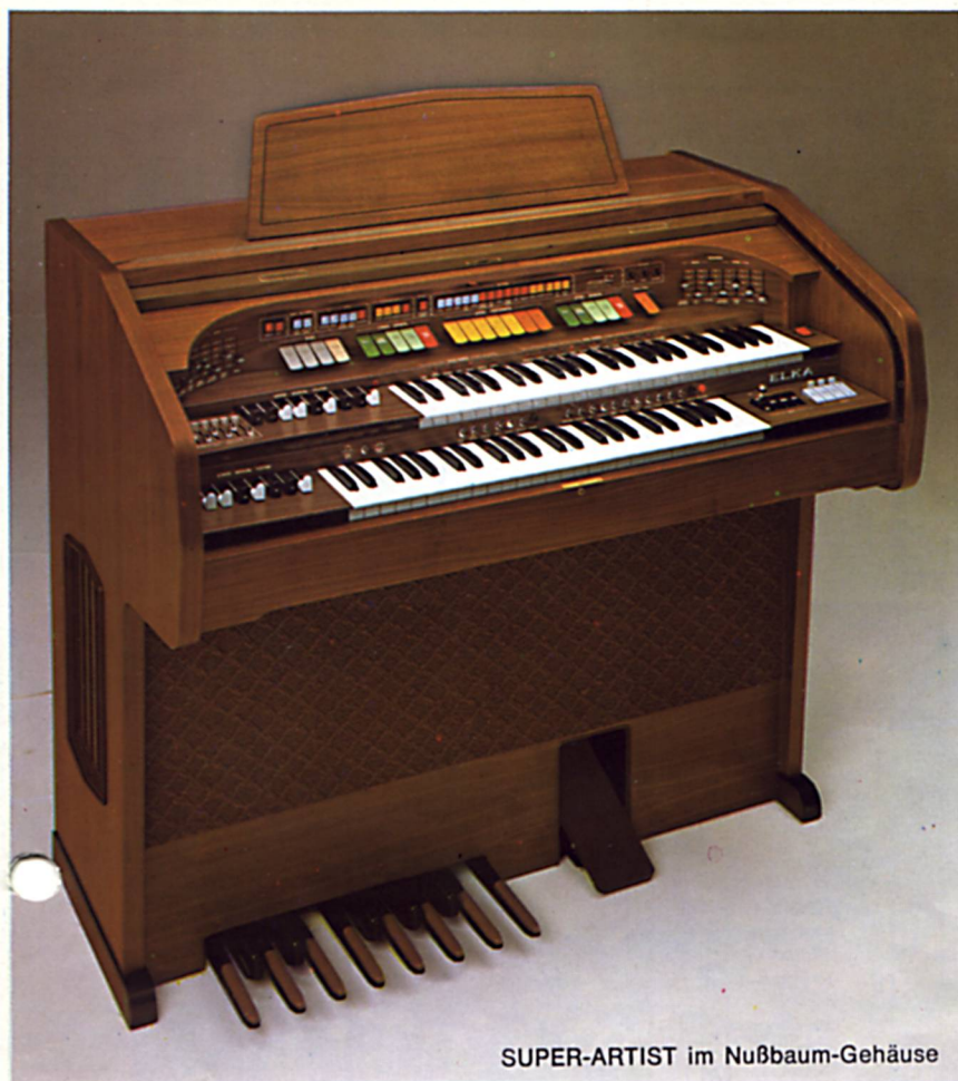
SUPER-ARTIST im Nußbaum-Gehäuse