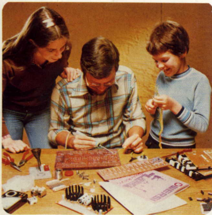
Ein Selbstbau-Spaß für die ganze Familie.

Musizieren und Selbstbau – zwei faszinierende Hobbies. Mit Wersi machen Sie Ihre Freizeit um vieles reicher.